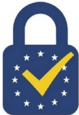
Figur 3 EU-tillidsmærket

Udbydere af kvalificerede tillidstjenester er berettiget til at benytte EU-tillidsmærket, se figur 3. EU-tillidsmærket for kvalificerede tillidstjenester skal benyttes på en måde, som gør det muligt at vise tydeligt, hvilke kvalificerede tjenester tillidsmærket gælder for. EU-tillidsmærket er defineret og brugen af det reguleret i gennemførelsesretsakten (EU) 2015/806 13 .