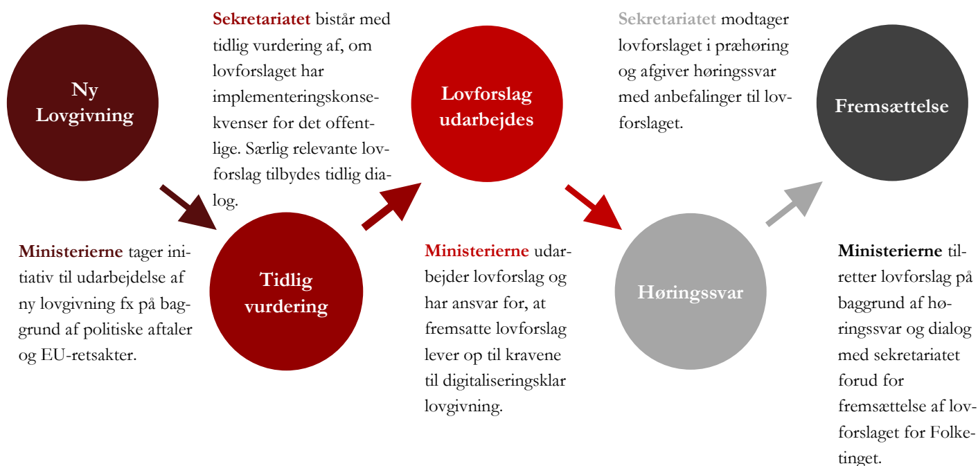
Figur 1 proces for arbejdet med digitaliseringsklar lovgivning

Figur 1 illustrerer sekretariatets indsats for at understøtte ministeriernes arbejde med digitaliseringsklar lovgivning fra et lovforslags begyndelse til fremsættelsen for Folketinget.