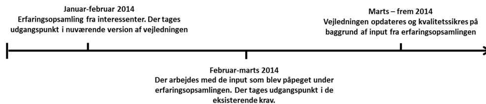
Figur 2: Tidsplan for erfaringsopsamling og opdatering af udviklingsvejledningen i 2014

Tidsplan og hovedelementer for den kommende erfaringsopsamling (se figur 2) er: