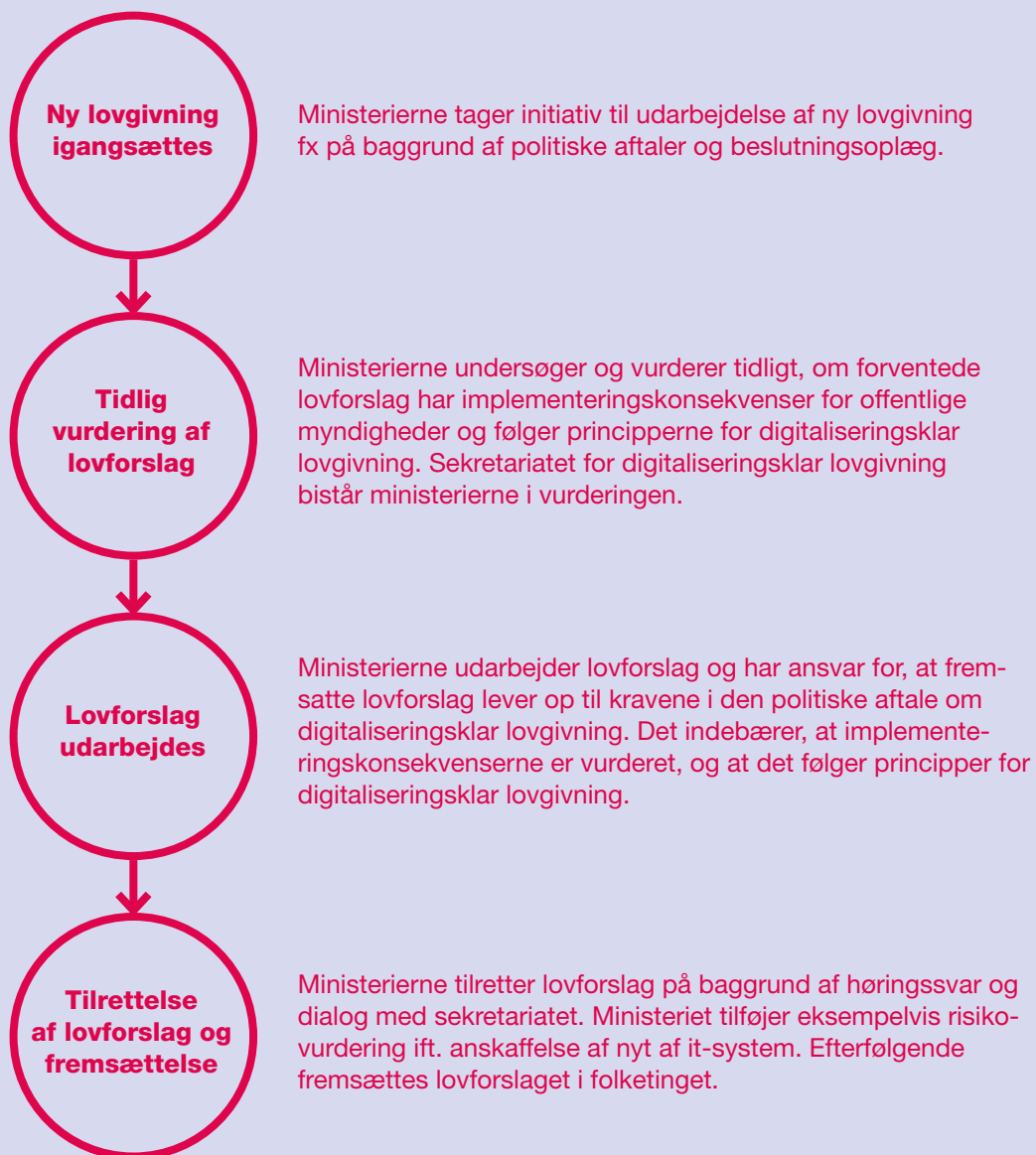
Figur 1 Proces for arbejdet med digitaliseringsklar lovgivning